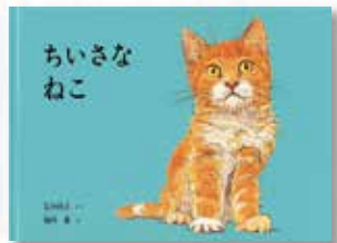
『ちいさなねこ 第88刷』 (こどものとも絵本) 石井 桃子(作)