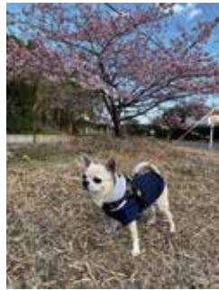
『桜とボク』 まめ造 春の訪れだワン!