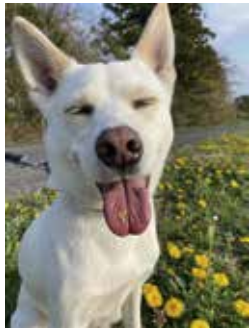
『春だワン!ダフル!』 コンちゃん 散歩にいい季節となりましたね。