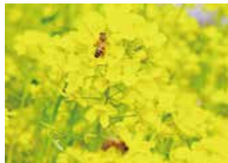
『春風のあいま』 アオちゃん