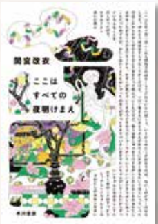
『ここはすべての夜明けまえ』 間宮 改衣(著)